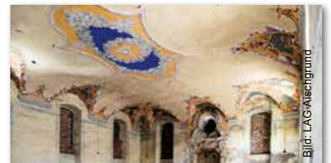
Bild Synagoge Mühlhausen: Für die ehemalige Synagoge in Mühlhausen wird ein Nutzungs- und Betriebskonzept erstellt.

Die neue Förderperiode der LAG Aischgrund hat begonnen. Gleich zu Beginn werden Projekte in Mühlhausen, Neustadt a.d.Aisch, Wachenroth und Herrnneuses-Schellert unterstützt. Für die ehemalige Synagoge in Mühlhausen, einen Inklusionsspielplatz in Neustadt a.d.Aisch und einer Bikepark-Anlage in Wachenroth werden Mittel aus dem LEADER-Förderprogramm der EU bereitgestellt. Aber auch für die Erinnerung an frühere Bestattungen bei Herrnneuses. Das hat der Vorstand der LAG Aischgrund auf seiner jüngsten Sitzung beschlossen.