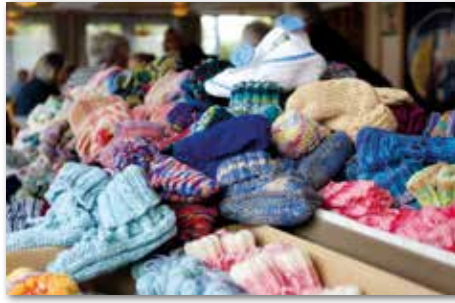
Zum Dankeschön-Frühstück brachten die ehrenamtlichen Strickerinnen gleich wieder Nachschub für die Willkommensmappe von Neugeborenen mit.

Seit 12 Jahren gibt es die Willkommensmappen mit Informationsmaterialien über Hilfe- und Beratungsmöglichkeiten für junge Familien im Landkreis und einem Paar handgestrickter Babysocken für die Neugeborenen. Im Durchschnitt wurden in den letzten Jahren circa 800 Mappen pro Jahr