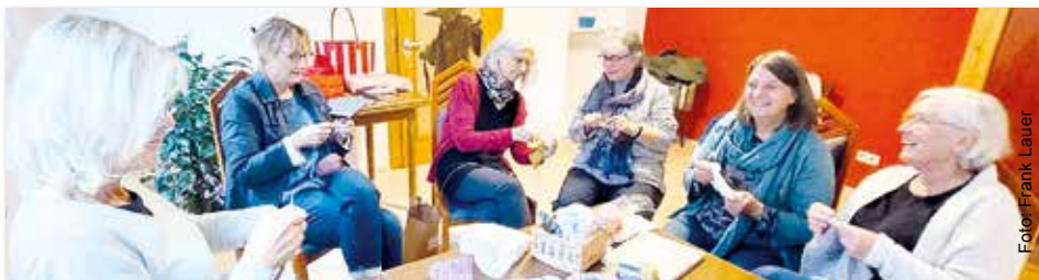
Diese Mitglieder der Gruppe BegegnungsWerkStadt treffen sich regelmäßig zum Stricken und Plaudern im „H1“.

die Räume bereits. Derzeit wird an einem Belegungsplan gebastelt. Neben den laufenden Renovierungsmaßnahmen steckt man derzeit in der Vorbereitung für einen „Tag der offenen Tür“, der am Samstag, 5. November 2022 , ab 11:00 Uhr stattfindet. Dann sollen die Bürgerinnen und Bürger vor Ort erfahren, was sich hier entwickelt. Schneider: „Wir wollen unsere Gäste bei einem ‚Markt der Möglichkeiten‘ mit kleinen Aktionen überraschen, aber auch Raum für Begegnungen und Gespräche bieten.“