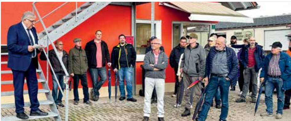
Landrat Helmut Weiß konnte auch in diesem Jahr viele Gäste auf der EVA zur Deponiekerwa begrüßen.

Thema wie der Arbeits- und Gesundheitsschutz – hierfür wurde das Sozialgebäude umgebaut und erweitert – sowie der Brandschutz auf den abfallwirtschaftlichen Anlagen des Landkreises. Auch die Beschaffung eines neuen Umschlagbaggers wurde besprochen und das aktuell im Einsatz befindliche Ersatzfahrzeug in Aktion gezeigt. Den Abschluss machte – wie immer bei der Deponiekerwa – ein gemeinsamer Imbiss auf dem EVA-Gelände.