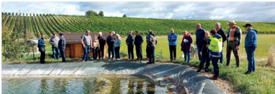
Exkursion zum Thema Weinbergberegnung bei Rüdlsbronn.

In Ipsheim wurde der vierte Workshop zum Thema „Sonderkulturen, Weinbau und Teichwirtschaft“ im August deshalb von Vertretern des örtlichen Weinbauvereins, der Landesanstalt für Wein- und Gartenbau, dem Institut für Fischerei und der Teichgenossenschaft Neustadt a.d.Aisch-Bad Windsheim begleitet. Im Rahmen einer Exkursion stellte der Betrieb Strebel und Popp zunächst seine Weinbergberegnung inklusive Wasserspeicherbecken bei Rüdlsbronn vor. Anschließend folgten Fachvorträge aus Weinbau und Teichwirtschaft mit gemeinsamer Diskussion rundeten den Workshop ab.