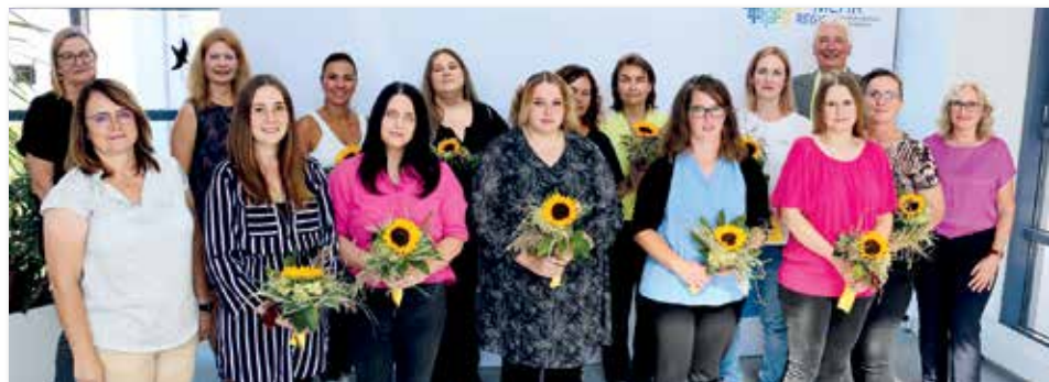
Die Kursteilnehmerinnen konnten nach bestandener Prüfung kürzlich ihre Abschlusszertifikate für Modul 1 der beruflichen Weiterbildung „Assistentkraft für Kitas“ entgegennehmen.

Die modulare Weiterbildung zu Assistentkraft für Kitas ist ein Projekt im Rahmen des neuen Gesamtkonzepts für die berufliche Weiterbildung des Bayerischen Familienministeriums. Ein zweites Einstiegsmodul wird im Landkreis noch in diesem Jahr angeboten, Anmeldeschluss ist hier der 13. Oktober 2023. Anmeldung und weitere Informationen unter www.vhs-nea-bw.de