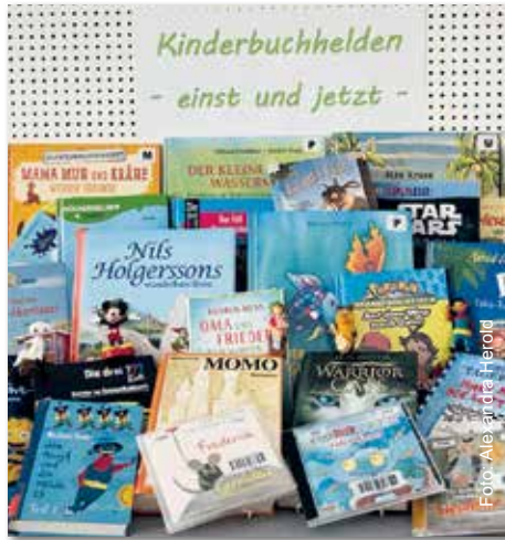
Kinderbuchhelden begleiten Kinder jeden Alters.

An diesem Nachmittag wird auch die Ausstellung „Kinderbuchhelden – einst und jetzt“ eröffnet. Den 100. Geburtstag von Otfried