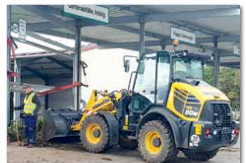
Auch der Radlader wurde in Aktion gezeigt.