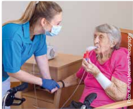
Vielfältige Aufgaben werden von Pflegefachkräften täglich bewältigt

Pflegeberufe bieten eine Vielzahl von Weiterbildungsmöglichkeiten an. Neben Weiterbildungen zum Beispiel zur Stationsleitung,