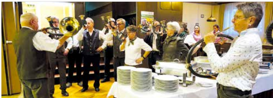
Eröffnung der Wildbretwochen im Gasthaus „Zum Goldenen Stern“ in Trauskirchen.