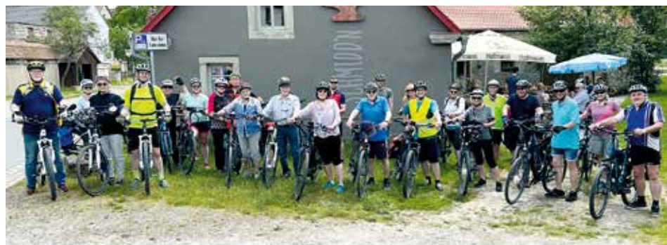
Viel Spaß hatten die Teilnehmer der geführten Kneipp-Radtour im Mai.