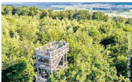
Der Aussichtsturm bei Markt Bibart ist eines der Ziele der Radtour am 18. Juni 2023.

Die Aussichtstürme bei Markt Bibart und bei Rüdlsbronn sind die Ziele einer geführten Radtour, die anlässlich des Naturparktags im Steigerwald am Sonntag, 18. Juni 2023 , stattfindet. Teilnehmende dürfen sich auf eine tolle Weitsicht über die Landschaft freuen, auf der Tour des Kreistourismus werden einige Höhenmeter zurückgelegt, etwa 30 Prozent der Strecke verlaufen auf geschotterten Waldwegen. Eine Einkehr auf Selbstzahlerbasis auf dem letzten Drittel der Tour ist geplant.