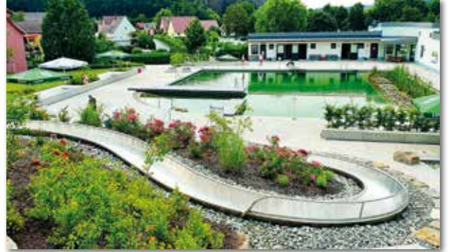
Das Steigerwald Mineralbad in Münchsteinach.