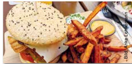
Der Karpfenburger ist eine besondere und moderne Variante des Aischgründer Karpfens.

Der aktuelle Flyer mit allen Informationen zu den 45. Aischgründer Karpfenschmeckerwochen sowie zum Karpfen-Gewinnspiel liegt ab sofort bei allen teilnehmenden Gaststätten aus. Den Flyer können Sie auch kostenlos per E-Mail an tourismus@kreis-nea.de oder unter www.frankens-mehrregion.de/prospekte anfordern. Unter allen Karpfenschmeckerfreunden werden ein Karpfen-Erlebnistag für zwei Personen und weitere tolle Preise rund um Karpfen und die Region verlost. Dazu muss während des Aktionszeitraums in die teilnehmenden Gaststätten eingekehrt und für jeden Besuch ein Stempel gesammelt werden. Senden Sie den Flyer mit drei oder