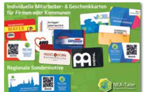
Beispiele für Sondermotivkarten.

Der Seniorenrat der Stadt Neustadt a.d. Aisch stellt das Thema: „Wenn Hilfe nötig ist“ am Freitag, 22. September 2023 um 18:00 Uhr ebenfalls im Rathaus Neustadt a.d. Aisch vor. Wohnortnahe Hilfs- und Unterstützungsangebote können dazu beitragen so lange wie möglich im eigenen Zuhause leben zu können. Meike Nenner von der Fachstelle für Demenz und Pflege Mittelfranken informiert über die verschiedenen Formate der Angebote zur Unterstützung im Alltag sowie zu deren Verfügbarkeit in Neustadt a.d. Aisch und Umgebung. Darüber hinaus gibt die Referentin Informationen zur Pflegeversicherung, deren Antragstellung, Begutachtung und Abrechnung. Am Mittwoch, 28. September 2023 wird im KinoNEA zum Thema Demenz eine Filmdokumentation präsentiert. Der Film beginnt um 19:00 Uhr. Kartenreservierungen unter der Tel. 09161 6217280 oder www.kino-nea.de