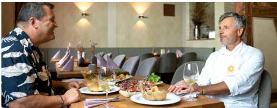
Im Gasthaus zur Sonne wird der Aischgründer Karpfen variationsreich serviert.