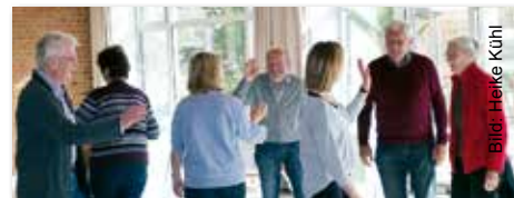
Uffenheimer Gruppe AOK-GeWinn beim Lachyoga.

Das Gruppenprogramm „AOK-GeWinn“ ist ein Gemeinschaftsprojekt der Gesundheitsregion plus und der AOK Bayern und wird im Landkreis Neustadt a.d.Aisch-Bad Windsheim in Uehlfeld, Uffenheim, Diespeck, Scheinfeld und Burgbernheim umgesetzt.