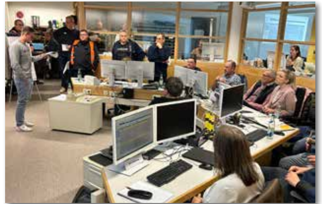
Im Katastrophenschutzkeller des Landratsamtes bei der Lagebesprechung.

bewerten. Landrat Helmut Weiß, der das Übungsgeschehen verfolgt hatte, lobte das besondere Engagement aller Beteiligten. „Übungen wie heute sind für uns im Katastrophenschutz unerlässlich. Sie sind wichtig, um Erfahrung und Sicherheit im Umgang mit einer Katastrophe oder Großschadenslage zu bekommen und weiter zu verbessern“, so Landrat Helmut Weiß bei der Besprechung. Im Anschluss lud er alle Beteiligten zu einem Mittagsimbiss ein, den der ASB und das BRK stellten.