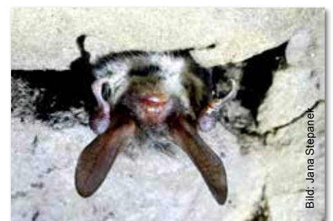
Eine Bechsteinfledermaus ist eine für den Steigerwald charakteristische Art.

Die sechs Landkreisberater appellieren an Besitzer von alten Bierkellern, diese bitte für Fledermäuse zugänglich zu machen. Ein ca. acht Zentimeter hoher und 40 Zentimeter breiter Einflugschlitz, im oberen