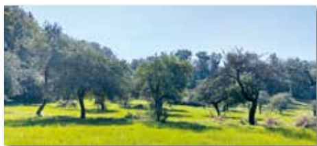
Eine Streuobstwiese bei Weigenheim.

Aktiv mitgestalten beim Projekt „Mehr Baamaland für Frankens Mehrregion“: Der Landschaftspflegeverband Neustadt a.d. Aisch-Bad Windsheim lädt mit der Gemeinde Weigenheim zu einem Streuobst-Workshop zum Projekt „Mehr Baamaland für Frankens Mehrregion“ ein. Die Veranstaltung findet am Donnerstag, 13. Februar 2025 von 18:00 bis 21:30 Uhr im Gasthaus Schwarzer Adler (Hauptstraße 26, 97215 Weigenheim) statt. Im Workshop haben die Teilnehmenden die Gelegenheit, aktiv mitzugestalten, wie