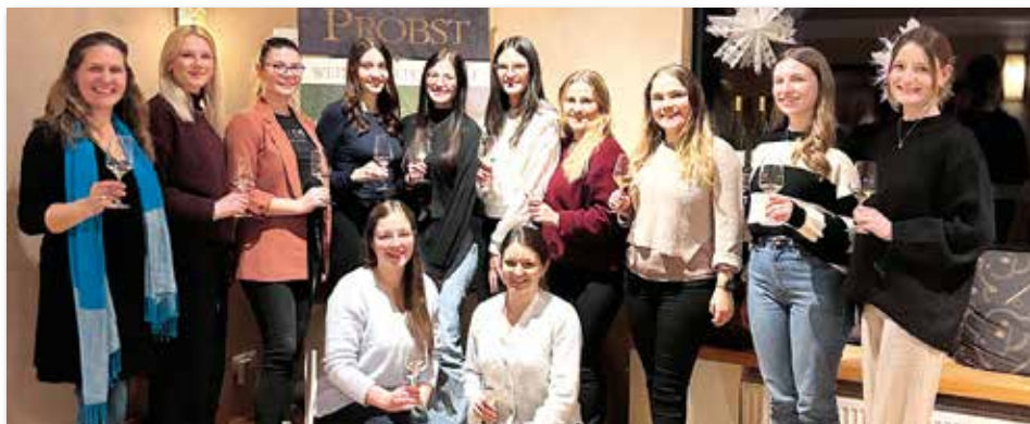
Ehemalige und amtierende Weinhoheiten beim Neujahrstreffen 2025 der Mittelfränkischen Bocksbeutelstraße.

Aktuelle Angebote und Aktionen der Mittelfränkischen Bocksbeutelstraße und eine Übersicht der Weinfeste gibt es unter: www.bocksbeutelstrasse.de .