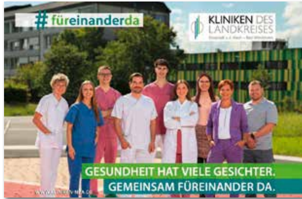
Eines der Kampagnen-Motive „Gesundheit hat viele Gesichter. Gemeinsam füreinander da.“