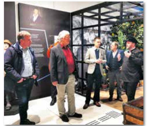
Interessante Einblicke gab das Bergbaumuseum „KohleWelt“ in Oelsnitz.

Die Delegation bekam ein vielfältiges Programm präsentiert, das den Gästen den Erzgebirgskreis und seine Geschichte näherbrachte, wie zum Beispiel ein Rundgang durch das neu eröffnete Bergbaumuseum „KohleWelt“ in Oelsnitz. Auch war die Delegation in der Großen Kreisstadt Schwarzenberg zu Gast, in der Stadt, in der vor 35 Jahren Vertreter der beiden Landkreise die Partnerschaftsurkunde unterzeichneten. Eine Besichtigung der Ausstellung „Perla Castrum“ im Schloss Schwarzenberg, ein Stadtrundgang und die Eintragung ins Goldene Buch des Erzgebirgskreises zur Verstetigung der partnerschaftlichen Beziehungen rundeten des Besuchsprogramm ab.