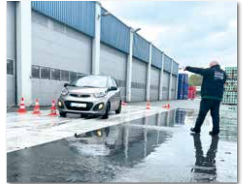
Angeleitet von erfahrenen Sicherheitstrainern kann beim Bremsen auf verschiedenen Untergründen mehr Feingefühl für das eigene Fahrzeug entwickelt werden.

Samstag, 14. Juni 2025: Bad Windsheim (Fa. Franken-Brunnen), 08:00 bis 12:30 Uhr