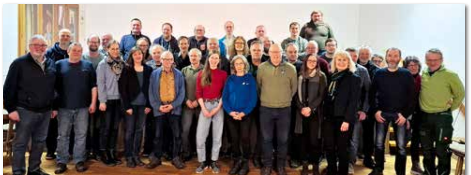
Beim Streuobst-Workshop in Weigenheim wurden Ideen zum Projekt „Mehr Baamaland für Frankens Mehrregion“ gesammelt.

Das Projekt „Mehr Baamaland für Frankens Mehrregion“ wird im Rahmen des Bayerischen Streuobstpaktes mit Mitteln des Bayerischen Staatsministeriums für Umwelt- und Verbraucherschutz gefördert.