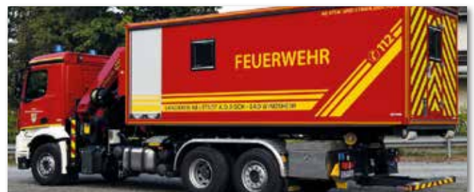
Trägerfahrzeug mit AB Atem- und Strahlenschutz.

Für die restlichen vier Abrollbehälter sind bereits die Aufträge vergeben. Mit dem ersten Hersteller konnte bereits eine Aufbaubesprechung stattfinden. Mit den anderen drei AB's wurde im Januar 2021 eine weitere Bauplanung veranlasst. Die Auslieferung der noch fehlenden Abrollbehälter AB Wasser, AB Einsatzleitung, AB Schlauch und AB technische Hilfeleistung sollen dann im Verlauf des Jahres 2021 erfolgen können.