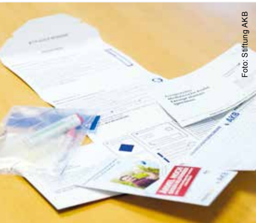
Das Lebensretterset zur Typisierung zuhause kann ganz leicht online bestellt werden.

Da derzeit keine öffentlichen Veranstaltungen möglich sind, ruft die gemeinnützige Stiftung zur Onlineregistrierung auf. Alle gesunden Menschen zwischen 17 und 45 Jahren können sich mit wenig Aufwand mit dem Lebensretterset der Stiftung zuhause registrieren. Das Lebensretterset lässt sich kostenlos auf der Website akb.de bestellen