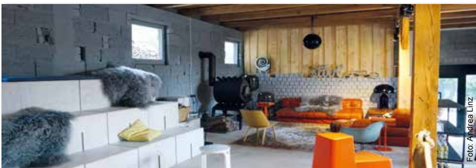
Der Hammerhof in Neuselingsbach – ein Zuhause für neue Ideen und frische Gedanken.